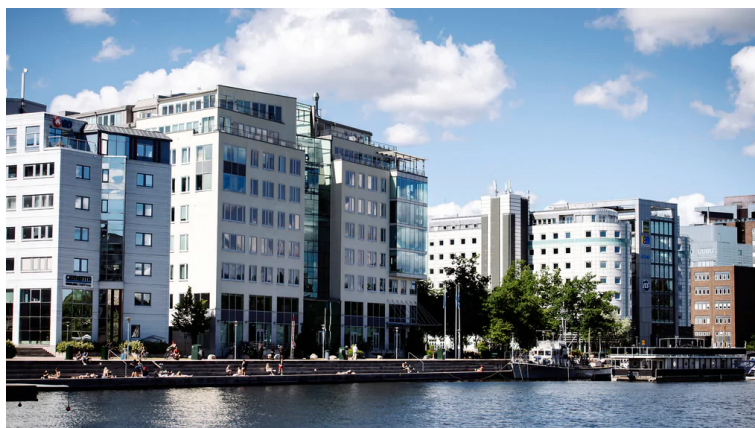
Liljeholmskajen