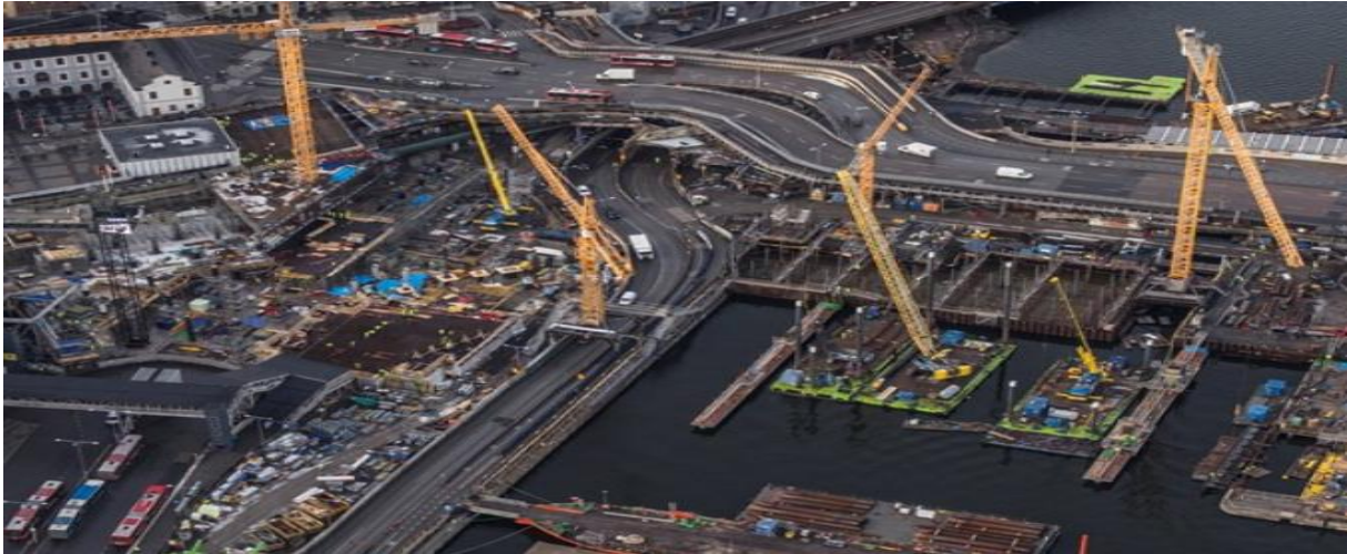
Slussen under konstruktion 2020

att föreställa sig hur det hela skulle se ut. Och dessutom skulle en jättebro från Kina fraktas in 4 .