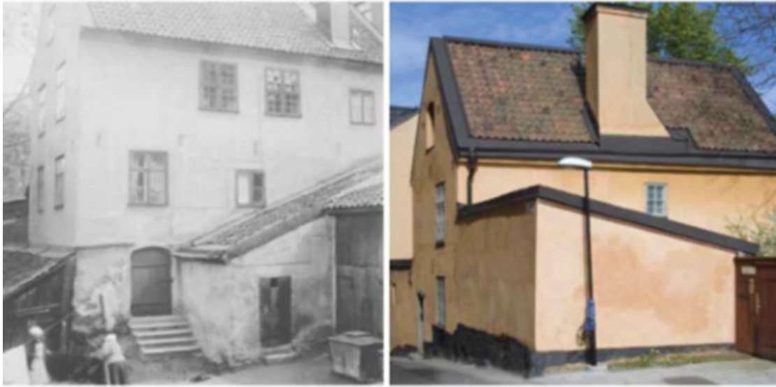
Från vänster: Klevgränd 1 c år 1905, Klevgränd 1c 1989

historia. Så när hon nu satt i sin egen trädgård i vårsolen och drack av sitt nybryggda kaffe så började hon läsa om Slussens och dess utveckling genom tiden.