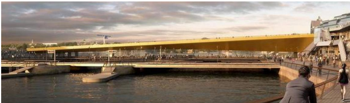
"Guldbron" Slussen. (Källa: Södermalm Direkt, 28 feb, 2020)