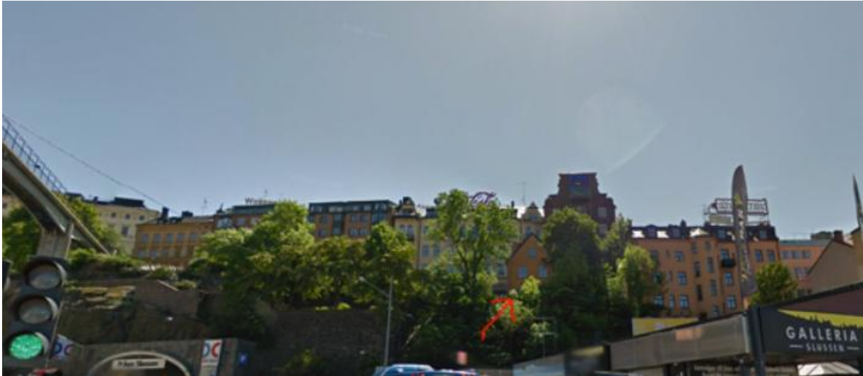
Huset på Klevgränd 1c. Fotograferat nerifrån Slussen 2012.

går morse fick hon besked om att boken gick att hämta Medborgarplatsens bibliotek. Med rollator och bibliotekskort var hon på väg redan samma eftermiddag. Och nu skulle hon få drömma sig bort en stund i förkovran om hennes egen favoritplats - Slussen.