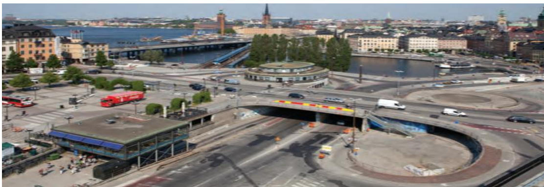
"Klöverbladsslussen" 2003.

Karl Johanslussen 1935 blir en modern sluss på 75 meter som ersätter den gamla. Efter 75 år så är även denna sluss uttjänt och vittrar sönder och sjunker allt mer ner i Mälaren. Slussen kom även att kallas för "Klöverbladsslussen". Ovanifrån ser nämligen bilvägarnas av- och påfarter ut som ett klöverblad 9 .